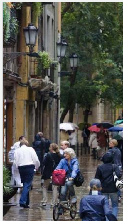
Peatones y ciclistas en la supermanzana del barrio de La Ribera.

¿Es esto aplicable a Vitoria? «Perfectamente», responde Rueda tajante. Y dice que es sencillo: el acceso a las vías interiores de las supermanzanas se restringiría mediante bolardos retráctiles. «Incluso se pueden dejar las calles como están y, simplemente, cambiar los sentidos del tráfico para evitar que vehículos atraviesen la zona», explica Rueda. Las seis supermanzanas previstas, además, «unirán los dos 'centros' de la ciudad: el actual y el que se conformará en Lakua con la estación intermodal, el auditorio, el Palacio de Congresos...».